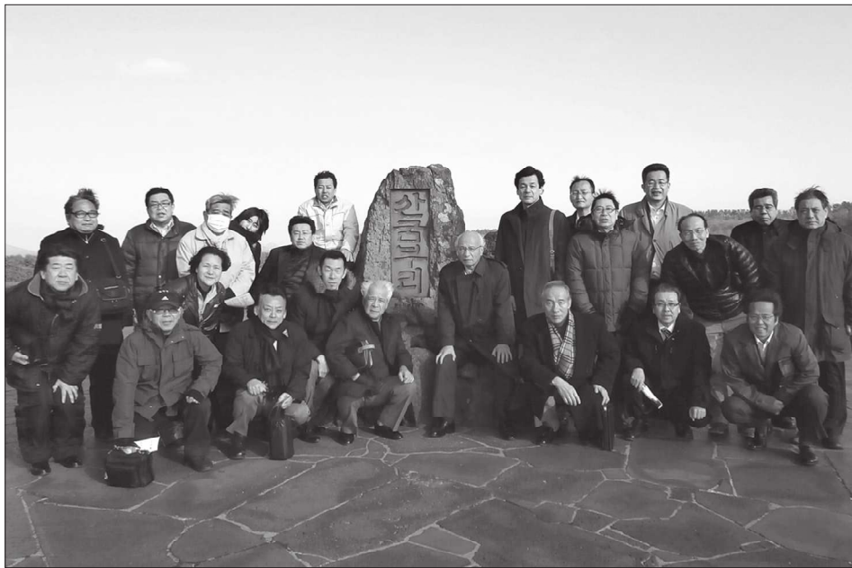
サンガムブリにて

初日の研修を終え、宿泊先のラマダプラザ済州へチェックインし、荷物を置いて夕食会場へ向かいました。