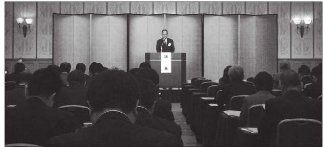
総会には276名が出席

■第1号議案=平成24年度事業報告の件 ■第2号議案=平成24年度収支決算報告の件 ■第3号議案=平成24年度監査報告の件 ■第4号議案=平成25年度事業計画(案)の件 ■第5号議案=平成25年度収支予算(案)の件 ■第6号議案=その他の件