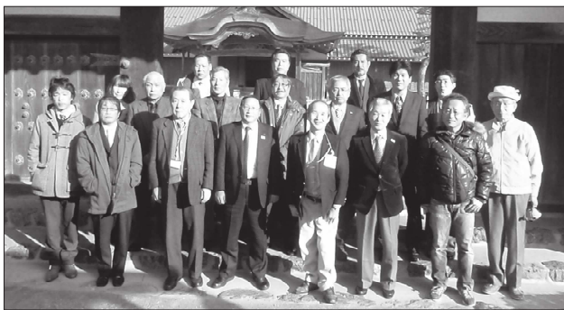
織田神社で記念撮影