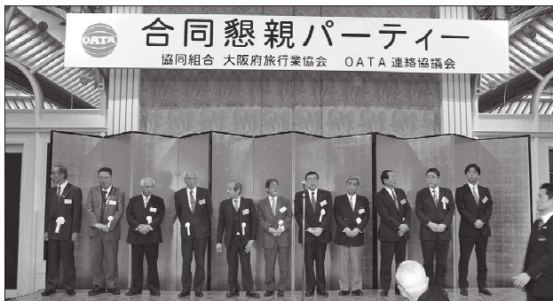
総会において選任されたOATA新役員

回通常総会終了後、OATA連絡協議会と「合同懇親パーティー」を開催し、来賓31名、OATA連絡協議会276