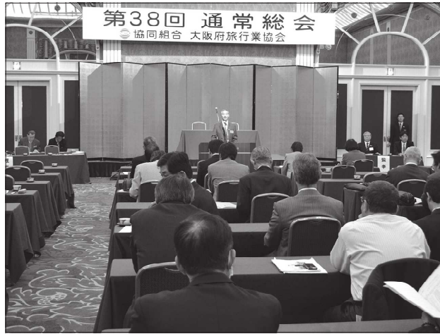
シェラトン都ホテル大阪で3月27日に開かれた総会

協同組合大阪府旅行業協会の「第38回通常総会」が3月27日(木)、大阪市・上本町のシェラトン都ホテル大阪において出席者84名(代理出席者