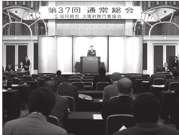
シェラトン都ホテル大阪で3月21日に行われた総会

協同組合大阪府旅行業協会の「第37回通常総会」が3月21日(水)、大阪市・上本町のシェラトン都ホテル大阪において出席者91名(代理出席