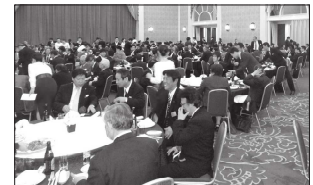
計451名が参加した合同懇親パーティー

会服部前総務部長のお二人の司会進行で、立食でなく初めての着席形式で行われた。組合員87名、来賓36名、連絡協議会326名の計449名のご参加をいただき、来賓ご挨拶・乾杯などの後、連絡協議会の役員の紹介も行われた。