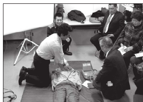
受講者全員に修了証が交付

総務委員会で取り組み、都島消防署のご協力で1月17日と19日、OATA会議室においてAED(自動体外式除細動器)救命講習会を開催しました。