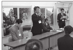
一行は、奈良井宿などを視察①し、長野県側40数名との現地商談会も開催した

経由し、伊那にあるみはらしファームで昼食と苺狩りを楽しみ、駒ヶ根の光前寺(しだれ桜)と養命酒工場を見学しました。盛りだくさんの予定を終え、19時半前に大阪へと戻りました。