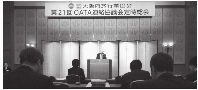
(案)の件 役員が報告後審議されたが、いずれも原案通り可決承認され、中副会長の閉会の辞で幕を閉じた。 【第6号議案】 役員改選の件 【第7号議案】 その他の件 以上議案について、それぞれの担当